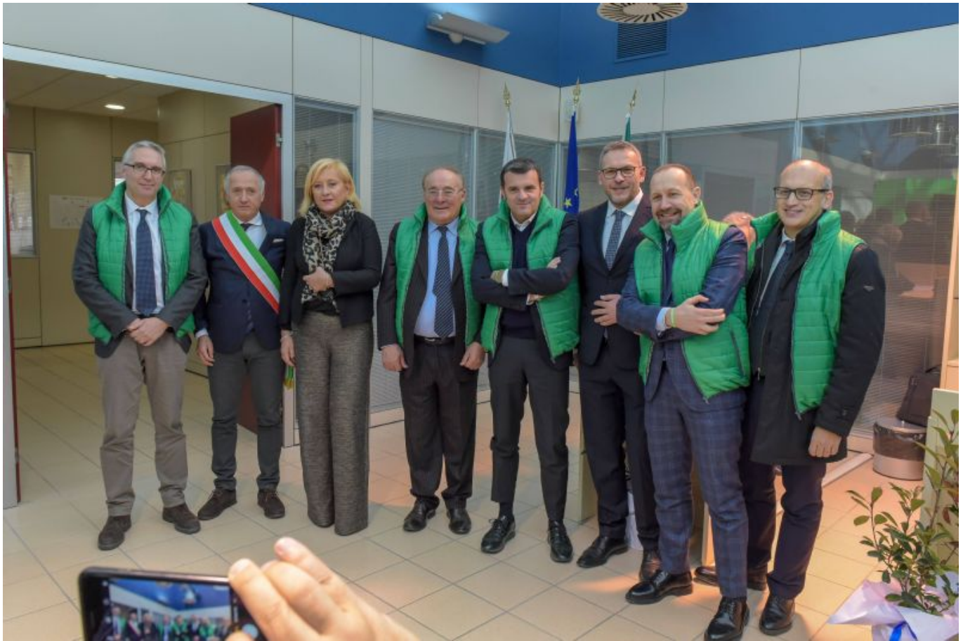
Un momento dell'inaugurazione