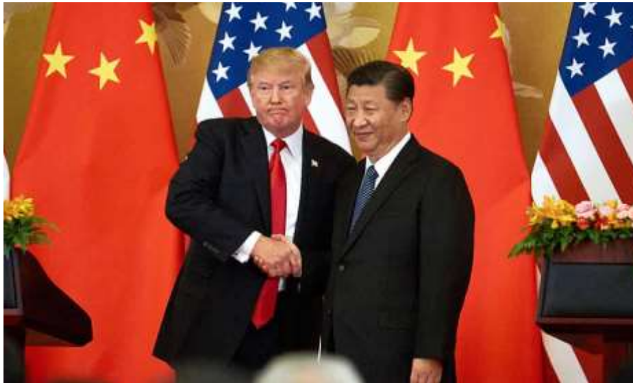
📷 Donald Trump meets China's president, Xi Jinping.

Beijing vows to retaliate against new 25% tariffs ... 'Off-rolling' forces poorly performing students out of schools ... and Freddie Starr bows out